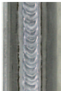
superPuls pro hliník pozice PF

Můžete zapomenout na „rozkyvu hořáku“ vyhrazenou pouze skutečným odborníkům, tuto skutečnost naopak velmi přivítá méně zkušený personál.