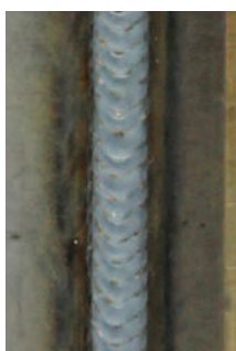
superPuls pro ocel pozice PF