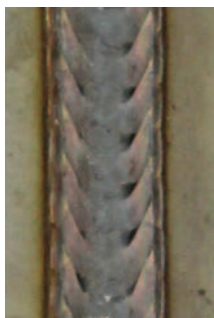
superPuls pro CrNi pozice PF